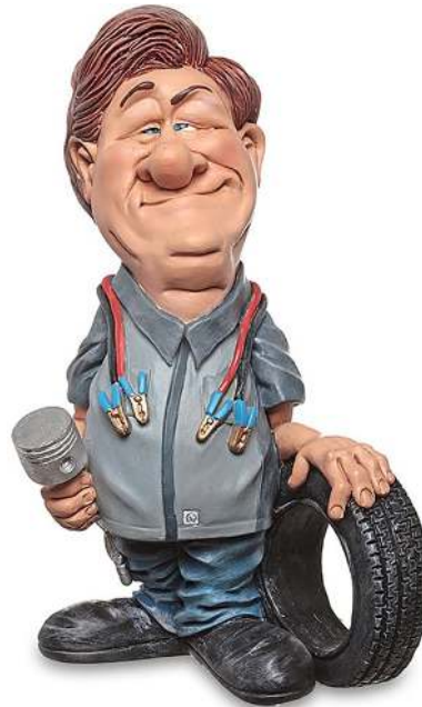
1 ste monteur/ APK keurmeester/ onderhoudsmonteur