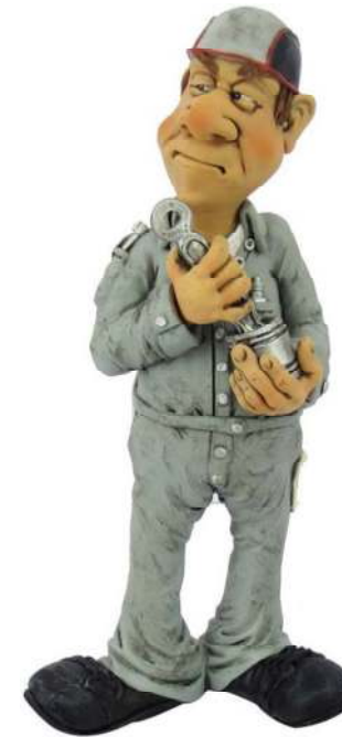
Technisch specialist/ APK keurmeester/ onderhoudsmonteur