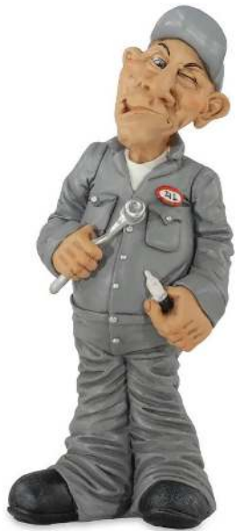
2 de monteur/ onderhoudsmonteur