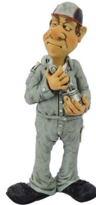
Technisch specialist/ APK keurmeester/ onderhoudsmonteur