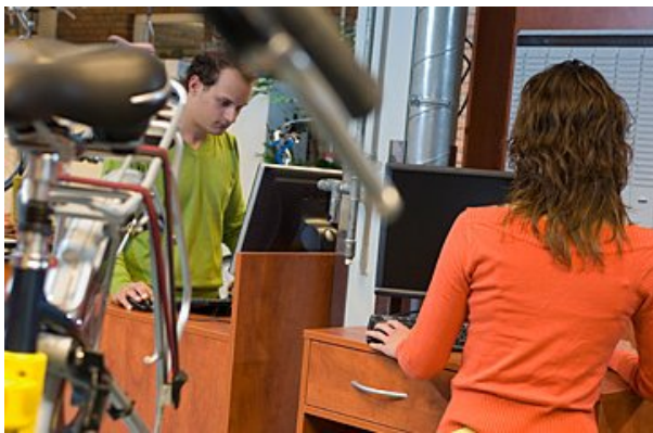
Heel veel gebeurt op de computer