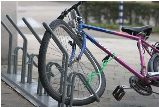
Werk voor de fietsenwinkel