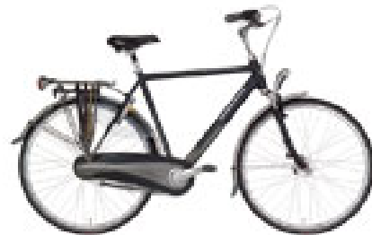
Stadsfiets (ook voor school)

Welke fiets is het meest geschikt voor jou? Zoek in de folders en op internet op welke fiets dat zou moeten worden. Vul de gegevens hieronder in.